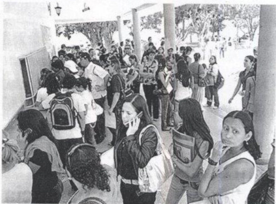
Se deben aplicar políticas para garantizar la prosecución estudiantil